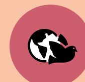
Weltkirche & Entwicklungshilfe