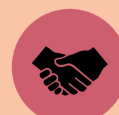
Soziale & karitative Aufgaben