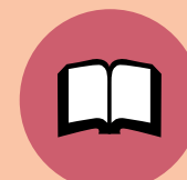
Bildung, Kunst, Kultur