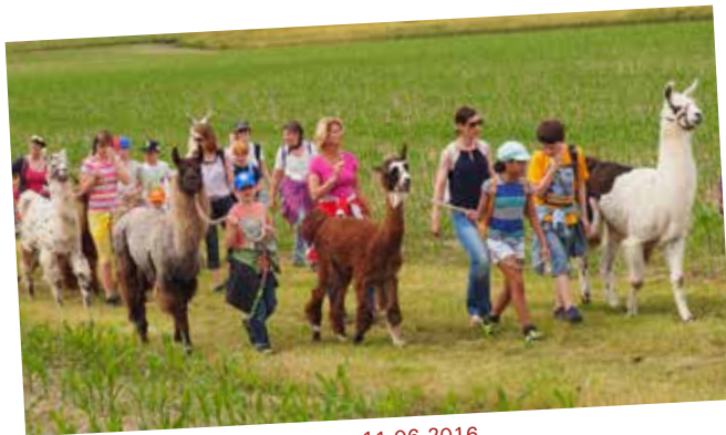
AE-Ausflug: Lamawanderung vom 11.06.2016