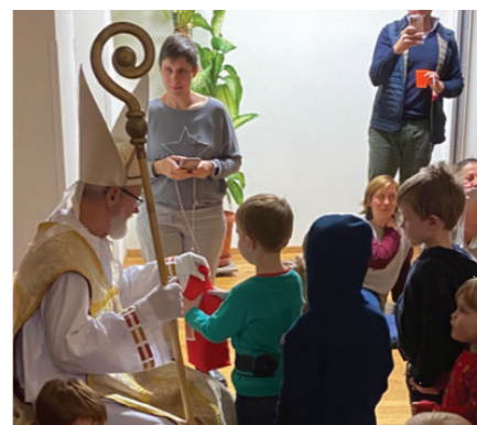
Der Bischof Nikolaus besucht alle Kinder in St. Hubertus am SA 6. Dezember um 15.00 Uhr. Anmeldung möglich über die Spielgruppe, den Kindergarten St. Hubertus und das Kiwogo Team!