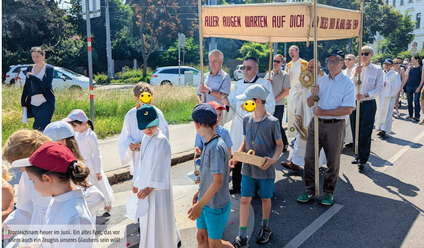
Fronleichnam heuer im Juni. Ein altes Fest, das vor allem auch ein Zeugnis unseres Glaubens sein will!