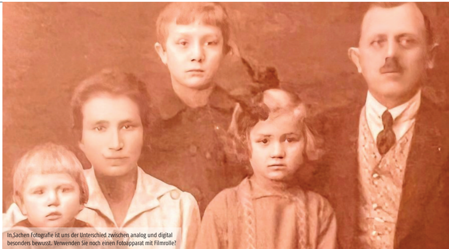
In Sachen Fotografie ist uns der Unterschied zwischen analog und digital besonders bewusst. Verwenden Sie noch einen Fotoapparat mit Filmrolle?