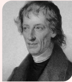
Bernard Bolzano (1781 – 1848): Theologe, Philosoph, Mathematiker, und Wissenschaftsethiker.

Bernard Bolzano wurde 1781 als Sohn deutsch-italienischer Eltern in Prag geboren. Er studierte an der Prager Karls-Universität Philosophie, Mathematik, Physik, und Theologie, dissertierte über Geometrie, und wurde 1805 zum Priester geweiht. Unmittelbar nach Studienabschluss wurde er mit dem k.u.k. Lehrstuhl für Religionsphilosophie an der Prager Universität betraut.