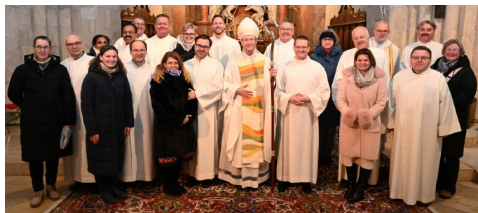
Text, Foto.: Peter Kasenbacher, wesentliche Ergänzungen zur Feier: Hans-Georg Mößner