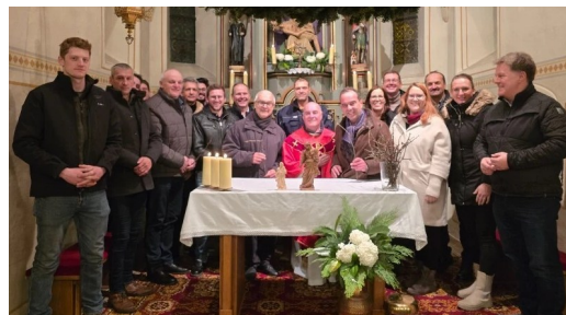
Text, Foto: Judith Haidl

Im Anschluss lud der Pfarrgemeinderat zu einer musikalisch begleiteten Agape. Die, von Pfarrer Branko gesegneten Barbarazweige, wurden an alle Messbesucher verteilt, viele freuten sich über die Kirschblüten am Hl. Abend.