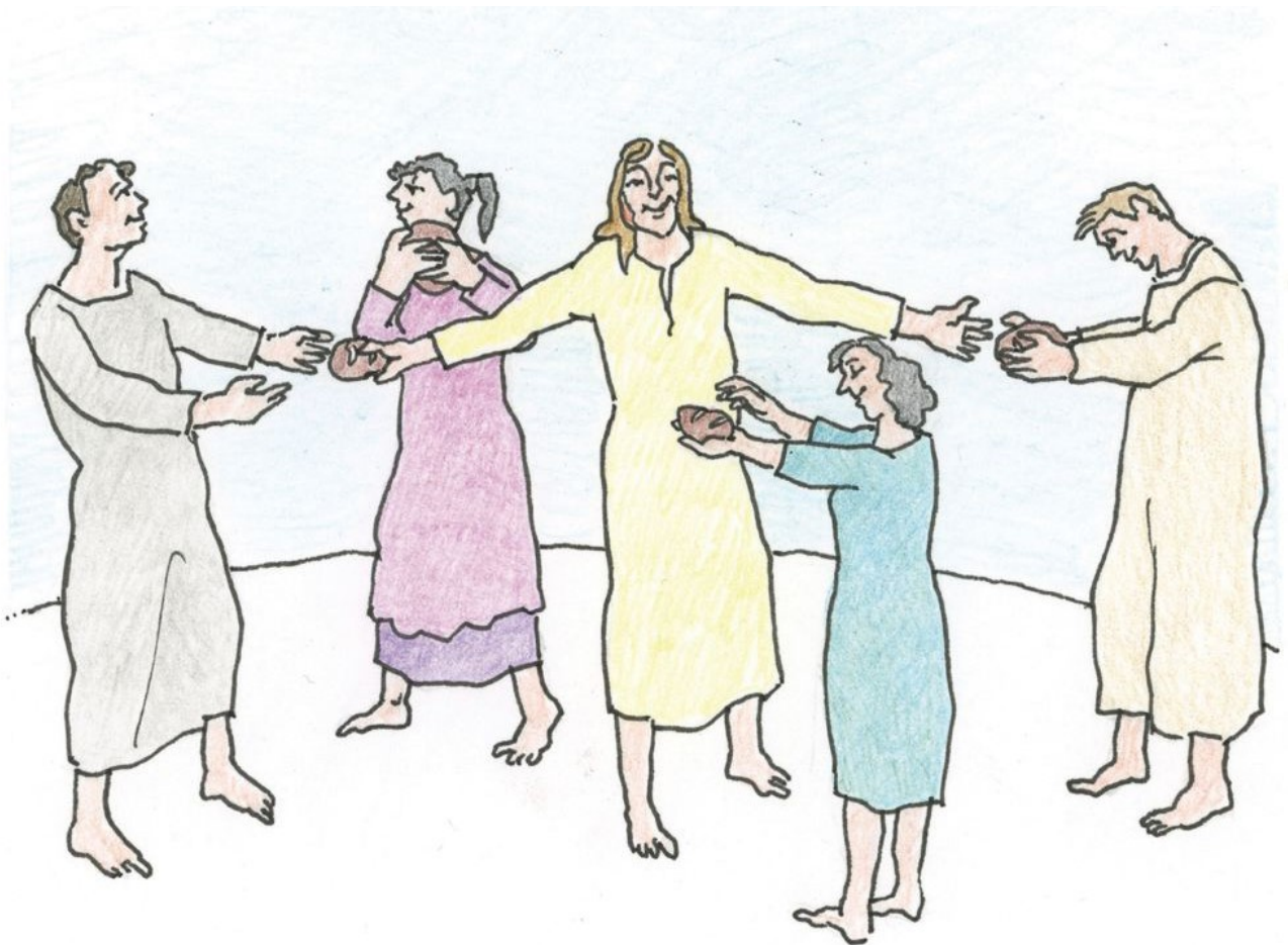
Illustration: Dieter Groß

und das ist im Evangelium nach Johannes aufgeschrieben.