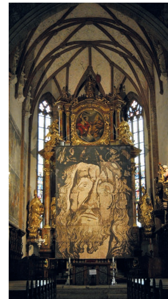
Fastentuch in Maria Saal, Kärnten