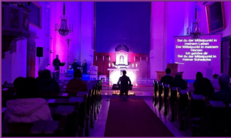
oben: 7. März 26, 19:30: "Night of Mercy", Frauenkirche