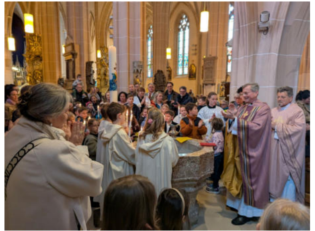
oben: 15. März 26, 09:15: Tafernerungsmesse der Erstkommunionkinder mit drei Taufen, St. Stephan