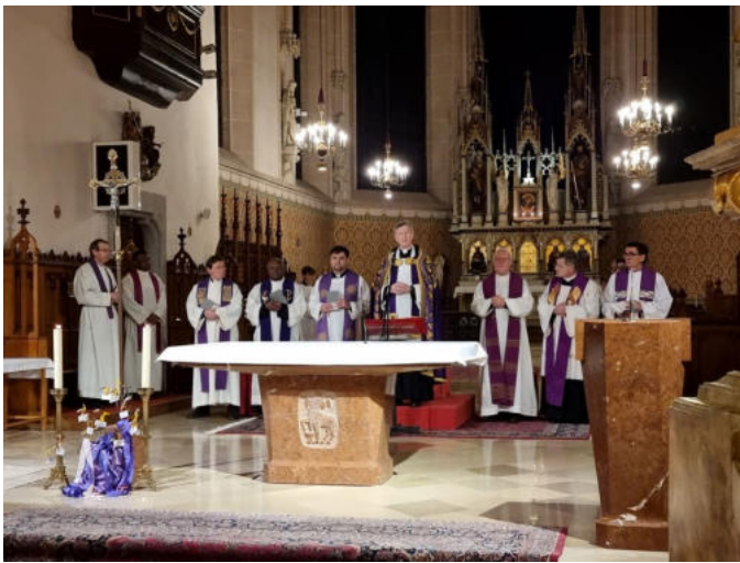
oben: 18. März 26, 18:30: Fest der Versöhnung mit Osterbeichte in St. Stephan, anschließend Agape im Pfarrsaal