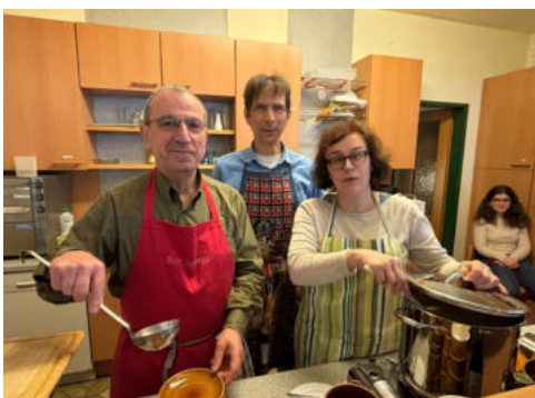
Links: So, 22. März 26: Fastensuppenessen im Pfarrsaal St. Stephan