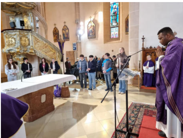
Links: 22. März 26, 09:15: Tafernerungsmesse der Firmlinge, St. Stephan