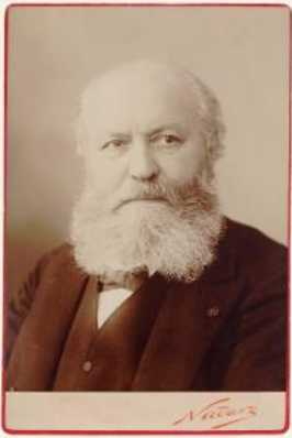
Charles Gounod

Im Festgottesdienst am Pfingstsonntag kommt es zu einer Erstaufführung in Baden – der „Messe solennelle en l'honneur de Sainte-Cécile“ in G-Dur von Charles François Gounod (1818–1893). Wer diese Messe kennt, wird sich fragen: Wie soll das gehen?! Und diese Frage ist durchaus berechtigt, da Gounod die bekannteste seiner Messen für großes Sinfonieorchester mit außergewöhnlicher Besetzung komponierte. Solopartien für Sopran, Tenor und Bass und ein vier- bis sechsstimmiger gemischter Chor bieten neben unglaublich zarten Passagen auch ein mächtiges Klangerlebnis. Außergewöhnliches bietet diese Messe in verschiedener Hinsicht, nicht nur im Orchester, sondern auch beim Text. Im Gloria folgt auf die Worte miserere nobis, gleichsam um der Bitte Nachdruck zu verleihen, die Anrufung Domine Jesu. Im Agnus Dei folgt auf jene Worte die sonst vom Volk gesprochene Bitte um Vergebung: Domine, non sum dignus ut intres sub tectum meum ... Die Bitte um Frieden wird mit einem dreimaligen Amen bekräftigt. Außergewöhnlich sind die Fürbitten, deren ursprünglicher Text für Kaiser Napoleon III. verfasst und in drei Wiederholungen gesungen wurde. Da der Text aber nicht mehr zeitgemäß ist, wird heute eine angepasste Version gesungen. Das rein instrumental gestaltete Offertorium war nicht unüblich in dieser Zeit. Das Besondere an der Orchesterbesetzung ist zunächst zweifellos die vermutlich erstmalige Verwendung eines Oktobasses. Dieses bis zu 3,50-m