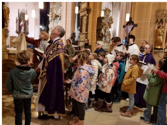
oben: 27. März 26, 17:45: Kinderkreuzweg in St. Stephan