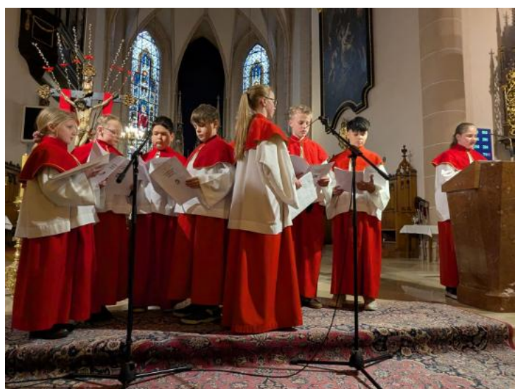
oben: 29. März 26, Palmsonntag: Palmprozession und Kinder-Passion in St. Stephan