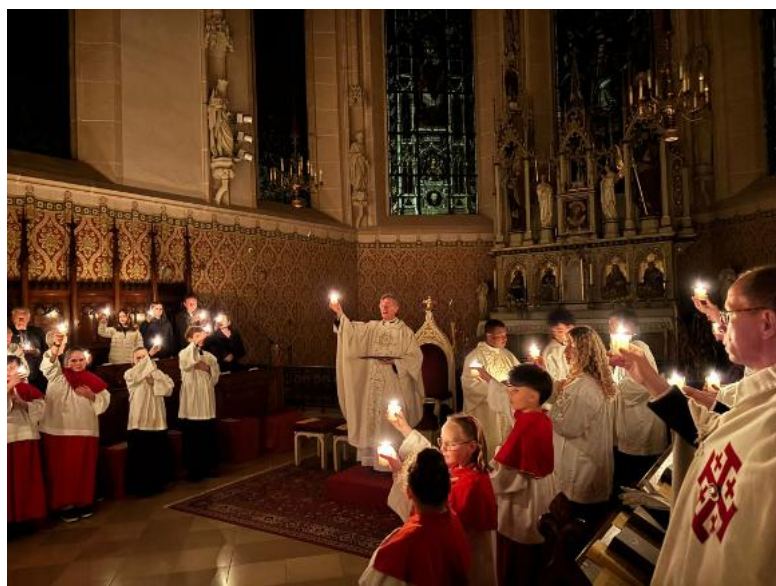
oben: 4. April 26, 20:30: Osternachtfeier in St. Stephan