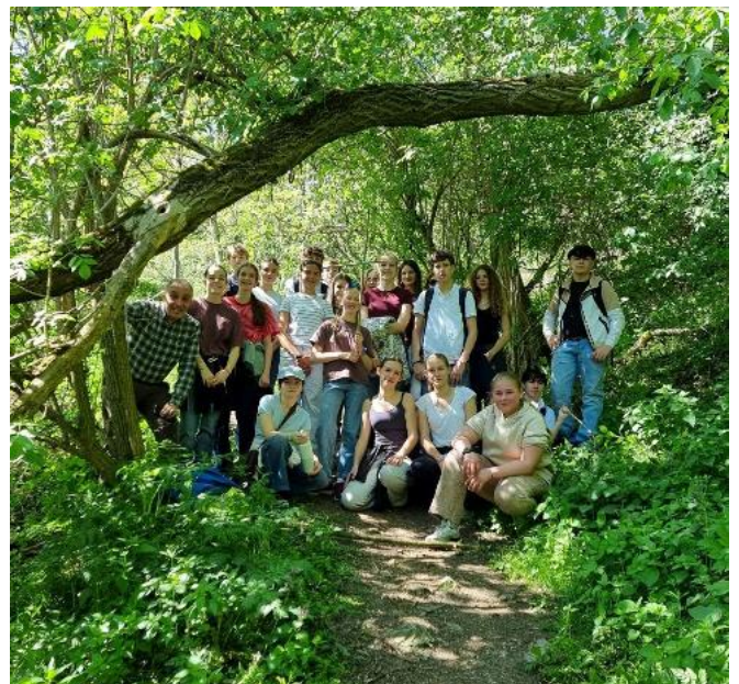
Samstag, 25. Mai 2026: Wanderung unserer Firmlinge hinauf zum Stift Göttweig im Rahmen des heurigen Firmwochenendes.

Eltern. Die Namensgebung am Tag der Taufe verschwand somit zunehmend. Dadurch kam es zu der heute üblichen Entkopplung von Namens- und Geburtstag. Doch zumindest in der Liturgie der Taufe hat sich etwas vom Namenstag erhalten: nicht nur werden die Eltern zu Beginn nach dem Namen gefragt, den sie ihrem Kind gegeben haben. Es wird in der Allerheiligen-Litanei auch explizit der Namenspatron des Kindes um Fürsprache angerufen. Es ist oft ein schönes Zeichen, wenn manch Taufspender dann auch die anwesenden Kinder- und auch die Erwachsenen - nach ihren Namenspatronen fragt, um auch diese in die Litanei einschließen zu können, sich ihrer Fürsprache zu versichern. Zusätzlich wurden und werden oft weitere Taufnamen gewählt - die heute meist die Verbindung zu einem besonders nahen Menschen, z.B. den Taufpaten - ausdrücken sollen.