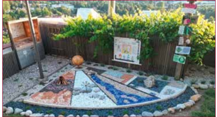
Das aufwendig gestaltete Bodenbild auf dem Kirchenvorplatz

Beim Eingang des Kirchplatzes befindet sich das von der Mittelschule Pitten gestaltete Bodenbild. Es war ein Projekt, das in vielen fächerübergreifenden Unterrichtsstunden und mit Hilfe unterschiedlicher Betriebe und Initiativen gestaltet wurde. Im Zentrum steht ein Holzglobus, den ein 14-jähriger