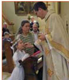
Die Stella-Schule feierte in Schwarzaun