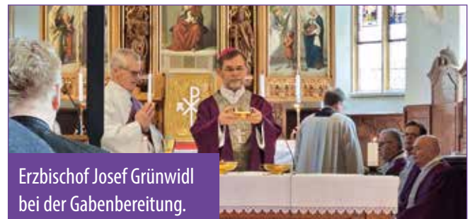
Erzbischof Josef Grünwidl bei der Gabenbereitung.