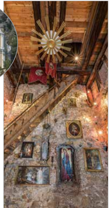
2014 wurde das Turmmuseum zum Hl. Georg in der „Bergkirche“ eingerichtet.