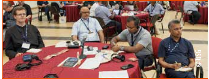
Zweimal im Jahr treffen sich die Generalsuperioren in Rom.