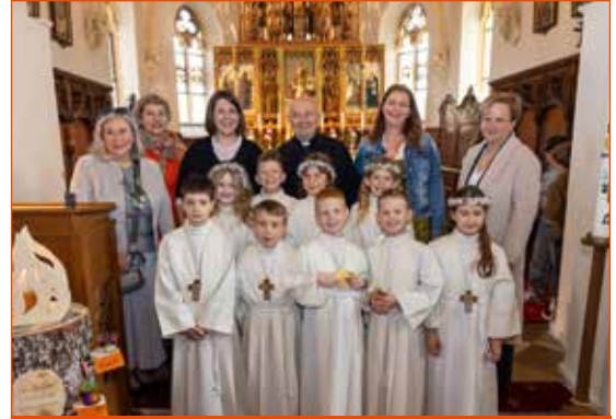
Neun Erstkommunionkinder gab es in Seebenstein.