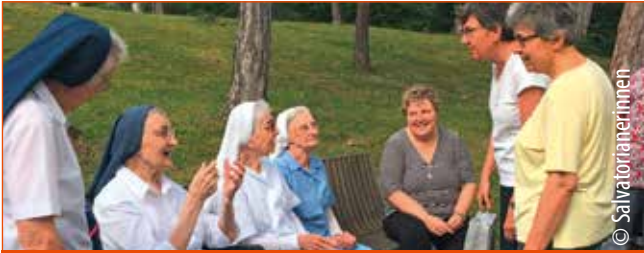
In Brunn lebt eine kleine Gemeinschaft von Salvatorianerinnen.