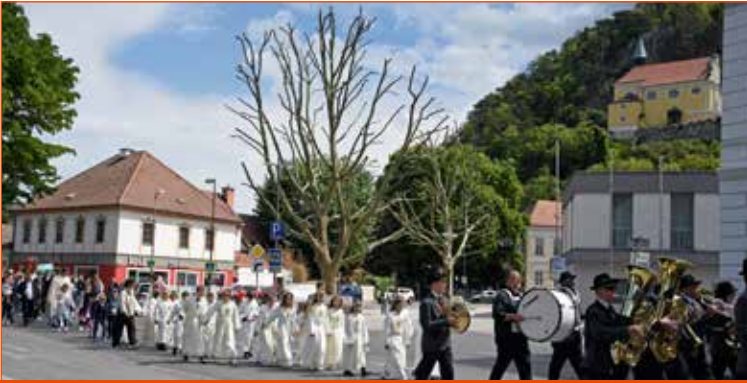
Pitten: Der Erstkommunionzug wurde von der Blasmusik angeführt.