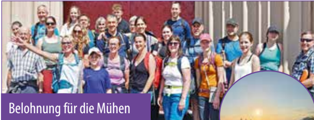
Belohnung für die Mühen