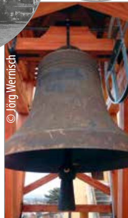
Die tontiefste Glocke wiegt 1.350 kg und datiert aus 1922.