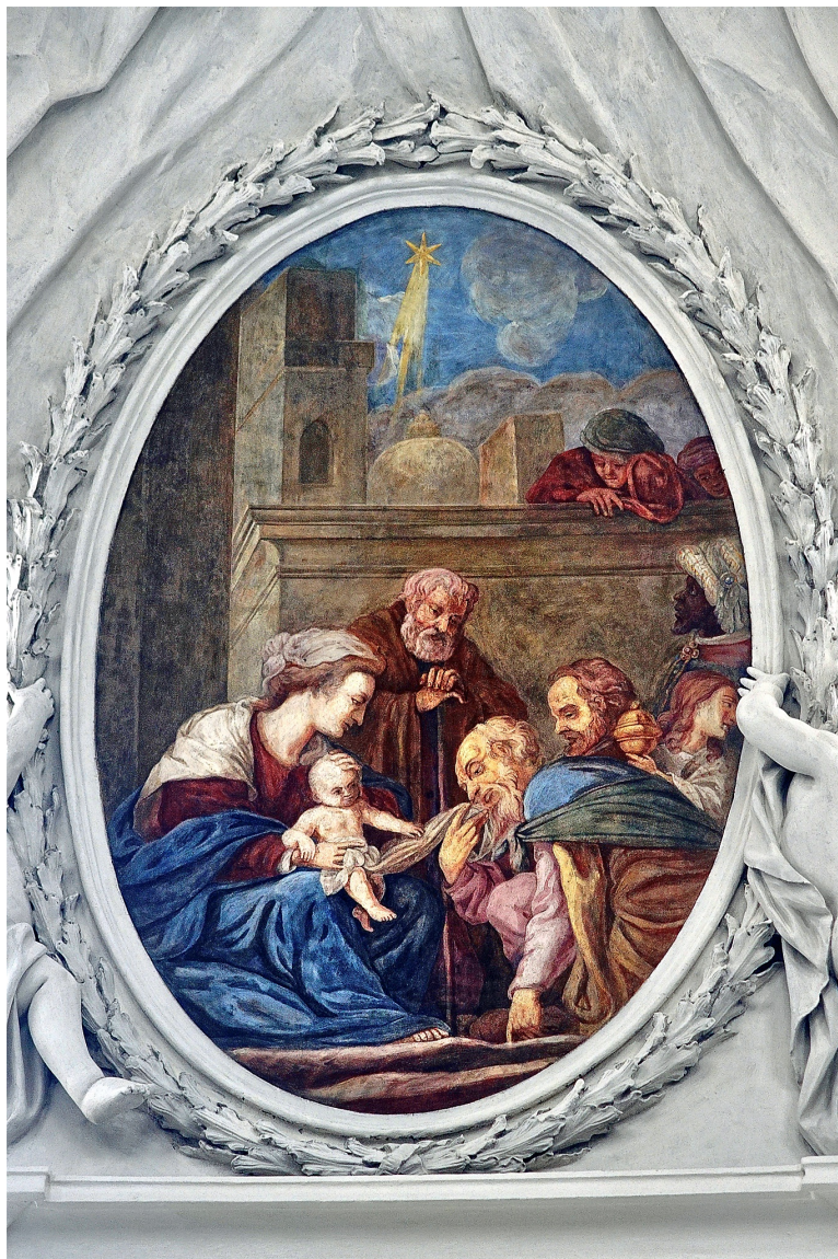
Detaill aus der Kuppel unserer Pfarrkirche.