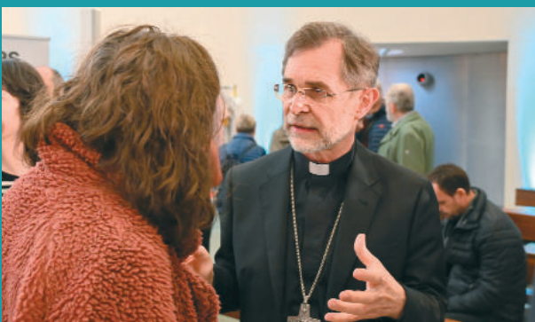
Erzbischof Josef Grünwidl im Gespräch