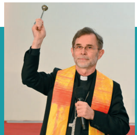
Erzbischof Josef Grünwidl segnet das Kirchenschiff