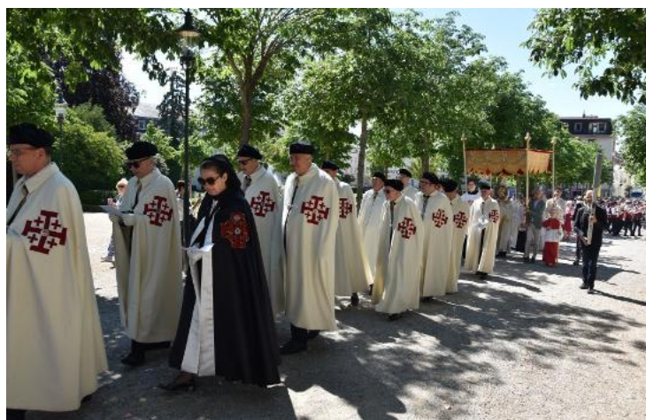
... Ritterorden vom Hl. Grab ...