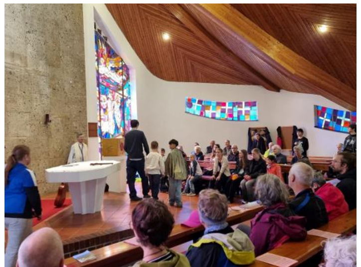
Darstellung der Lesung über den Propheten Elia in der Bruder Klaus Kapelle am Hubertussee durch die Minis.