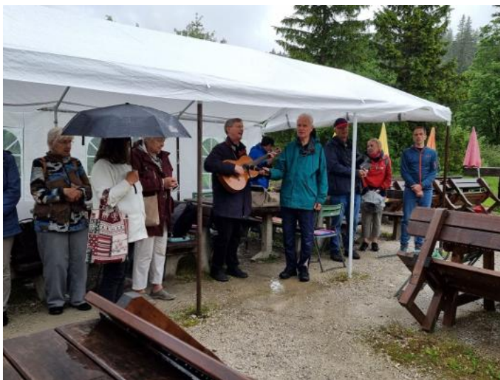
Start bei strömendem Regen im Fadental (Wuchtl-Wirtin).