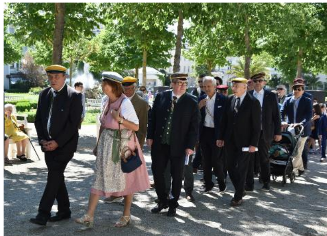
... Vulkania, Badenia, Veritas, Badener CV Zirkel ...