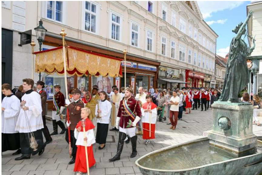
Prozession auf dem Weg zurück zur Stadtpfarrkirche.