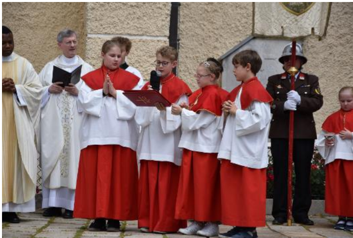
Minis beim Lesen der Fürbitten.