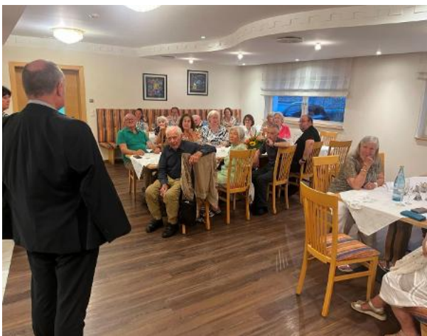
Besuch von Bischof Ivo Mauser (Bischof der Diözese Bozen-Brixen) in Meran.