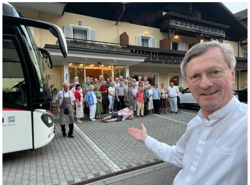
Vor dem Hotel Elisabeth in Meran.