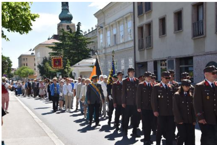
Prozession mit Feuerwehr und Kameradschaftsbund ...

Donnerstag, 4. Juni 2026 - Fest Fronleichnam