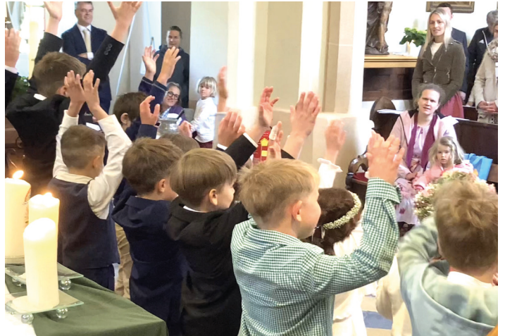
Erstkommunion in der Prein – die Reichenauer und Edlacher waren auch da