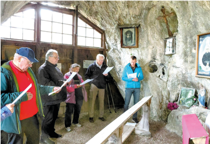
Maiandacht im Gaiskircherl