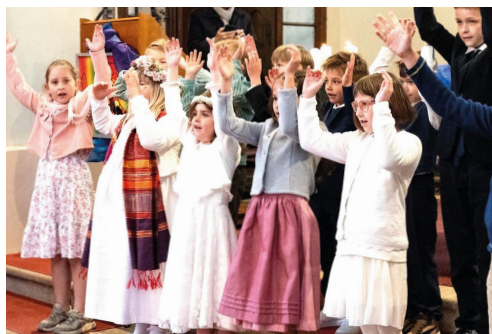
Erstkommunionkinder in der Prein