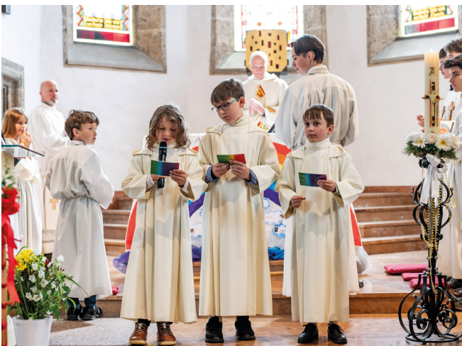
Erstkommunion in Payerbach

Sie vertrauten den Engeln, wie auch wir Gott und der Zukunft vertrauen können – denn das Leben geht weiter, über uns hinaus, zuerst im hier und jetzt, und danach, hoffentlich, als ewiges Leben im Himmel. □