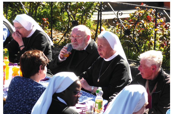
Nach der Maiandacht im alten Kloster in Edlach