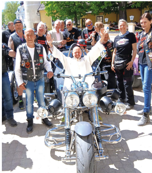
Biker-Segnung in Reichenau