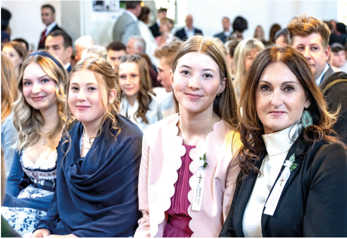
Firmung im Pfarrverband – diesmal in der großen Kirche in Gloggnitz