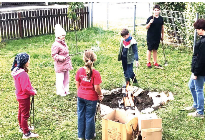
Jungschar beim Erdäpfelbraten im Pfarrgarten