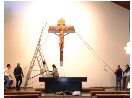
Das Kreuz verlässt die ehem. Hirschwanger Kirche