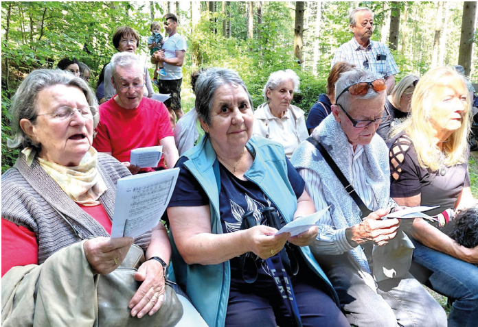
Maiandacht beim Augenbründl