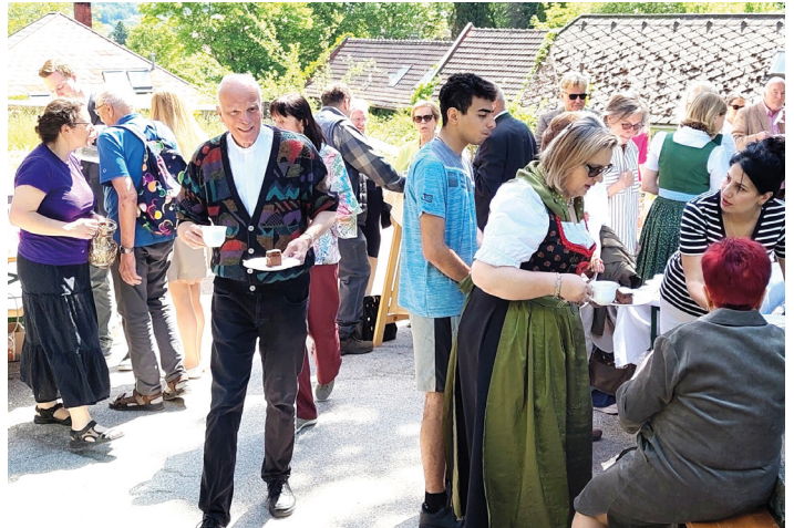
Pfingstgagge in Payerbach