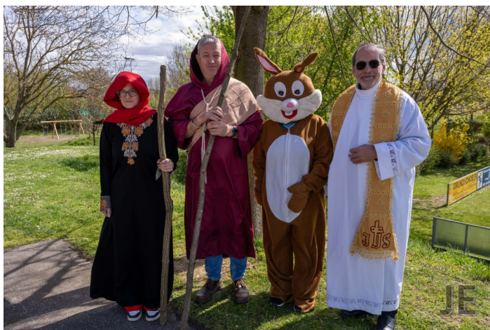
Schauspieler*innen, Osterhase und Kaplan Boboruta