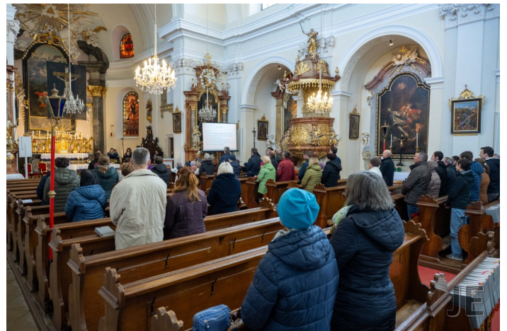
gut besuchte Messe