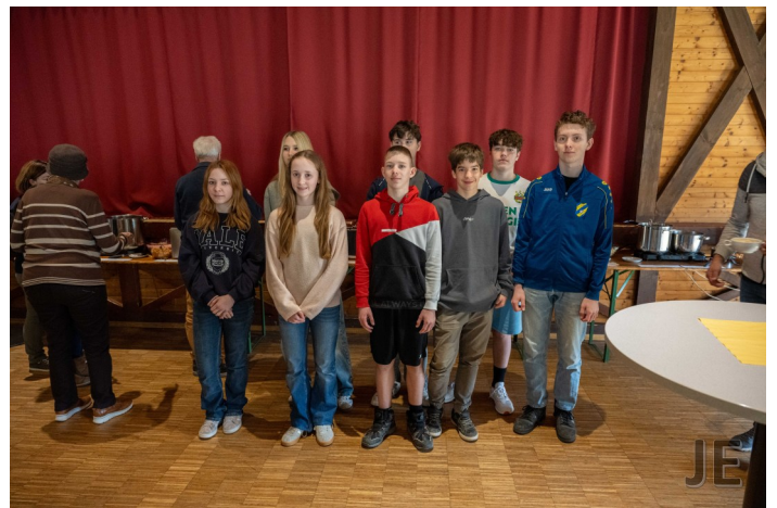
die Firmlinge halfen fleißig mit