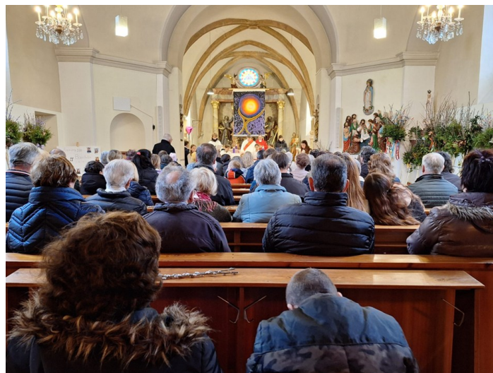
Ein Blick von hinten auf die volle Kirche