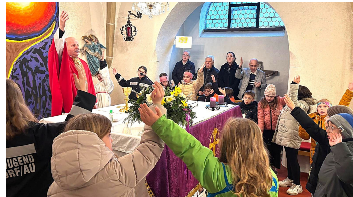
Beim gemeinsamen Vater Unser.