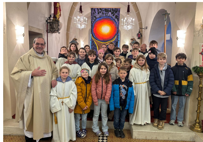
Segnung der Ratschenkinder.