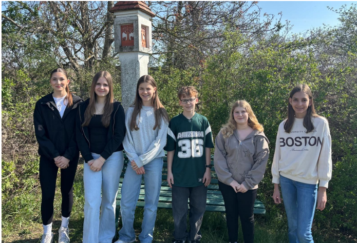
die Firmlinge aus Königsbrunn

Beim Firmworkshop im April wanderten die Firmlinge des Pfarrverbandes gemeinsam am Wagram und verbrachten anschließend den Nachmittag im Pfarrgarten. Mehr Infos zur Firmvorbereitung finden Sie im Pfarrverbandsteil.