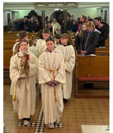
Der Heiland ist erstanden