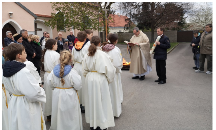
Segnung des Osterfeuers