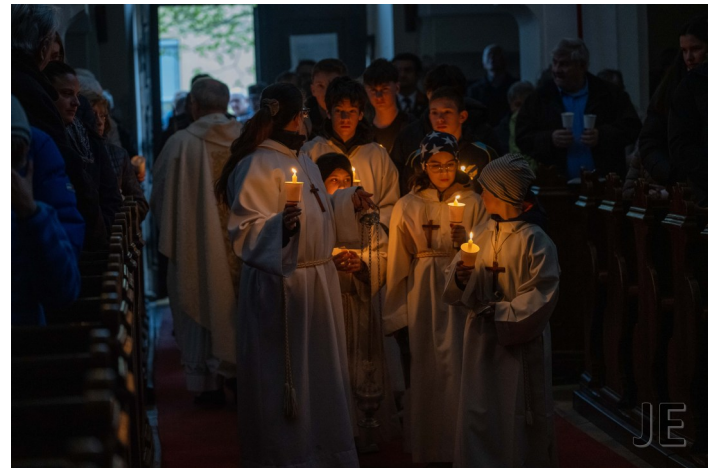
Ministrant*innen beim stimmungsvollen Einzug