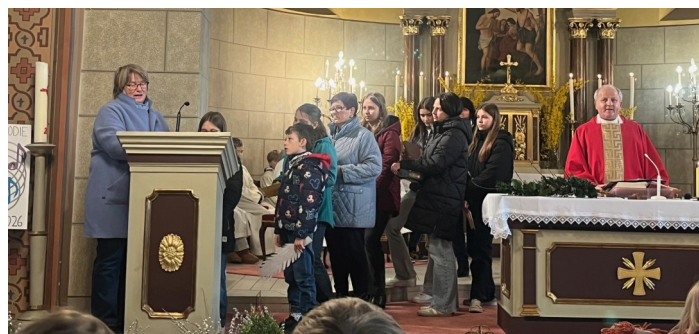
Leidensgeschichte in Wort und Bild