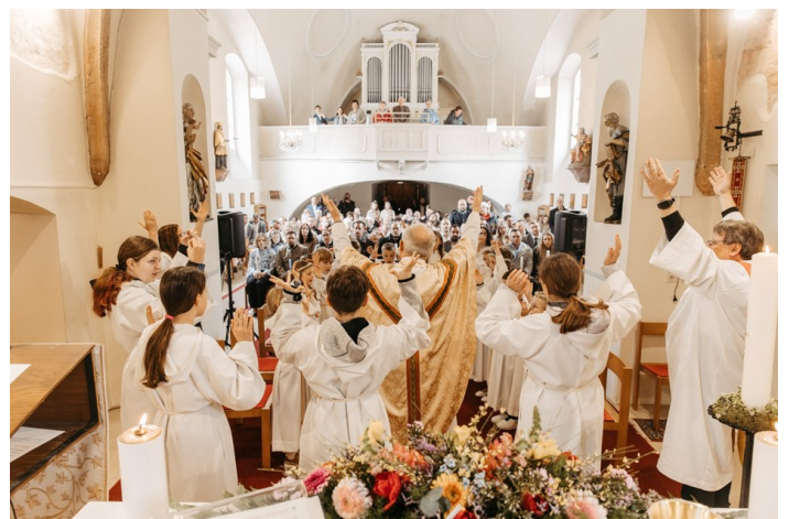
ein festlicher Gottesdienst