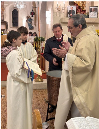
Segnung des Taufwassers