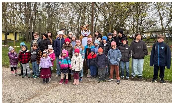
Gruppenfoto bei der Ostereier-Suche