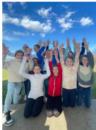
aktiver Nachmittag beim Wagramfenster