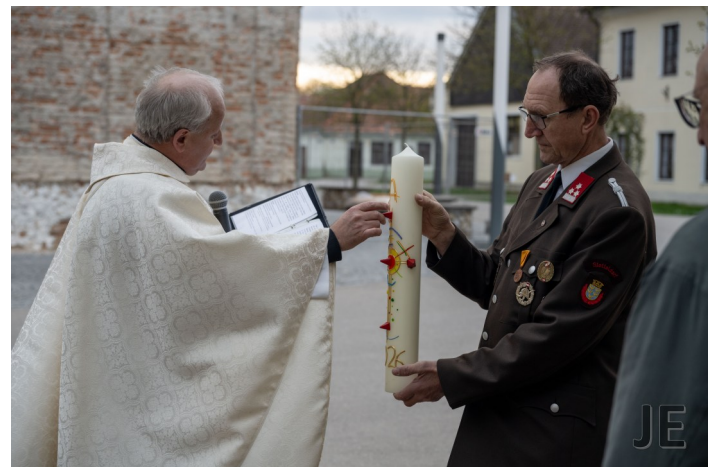
Segnung der Osterkerze