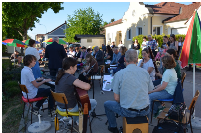
Musikgruppe O_M_TSCHI begleitete die Maiandacht.