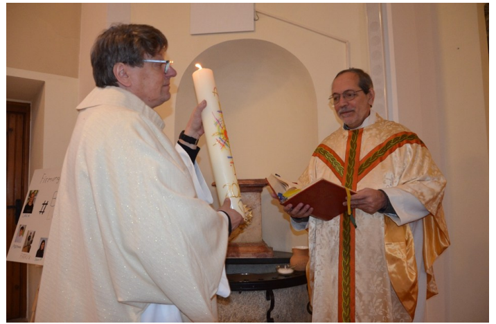
Segnung der Osterkerze