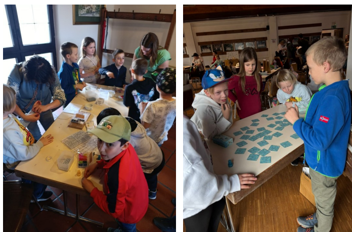
verschiedene Stationen beim Fest der Versöhnung