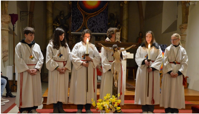
Ministrant*innen am Karfreitag