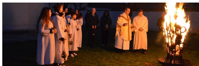
Das Osterfeuer wurde nach der Messe entzündet.