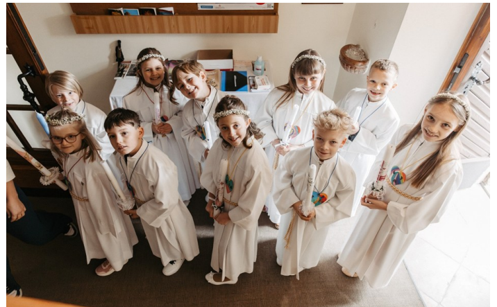
EK-Kinder vor dem Einzug - die Aufregung steigt