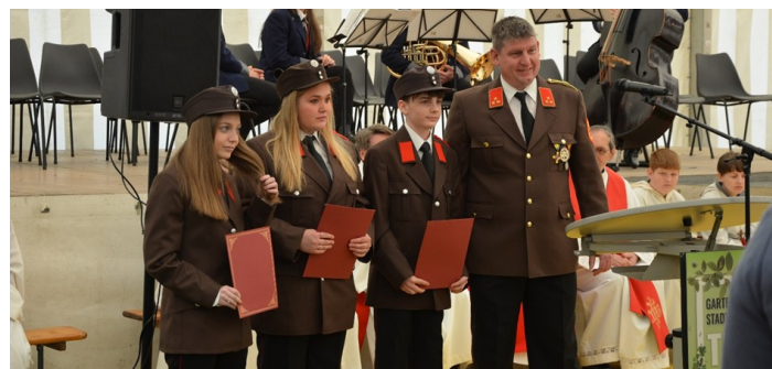
Angelobung neuer Kamerad*innen