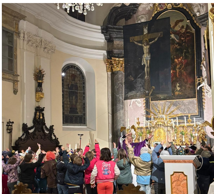
Die EK-Kinder während dem Albengottesdienst.