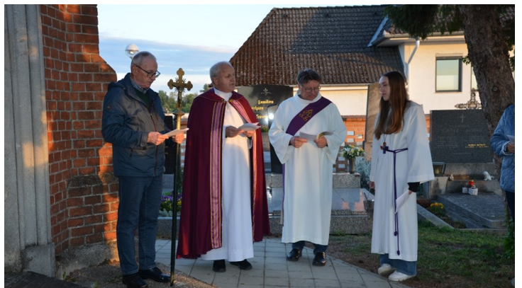
gemeinsames Gebet vor der Friedhofskapelle