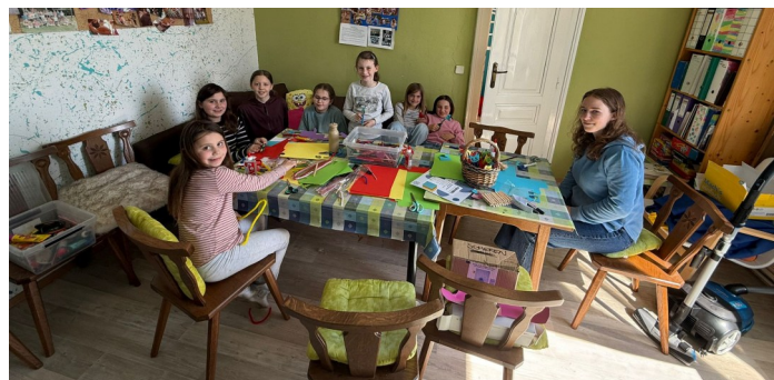
basteln für die Jungscharmesse