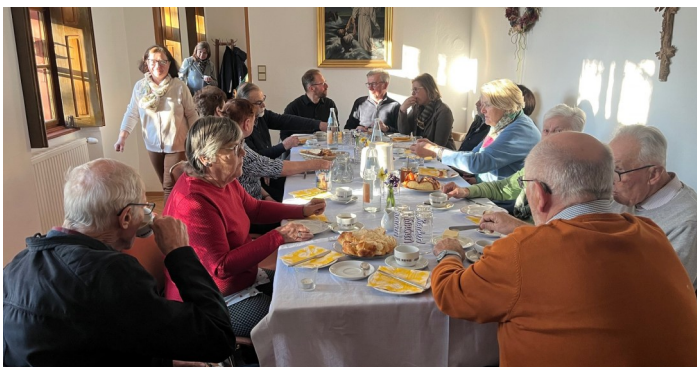
Striezel-Frühstück im Pfarrhof