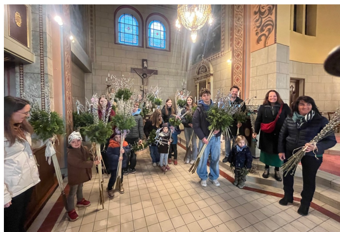
Die Kinder freuen sich schon auf das Verteilen der Palmbuschen.