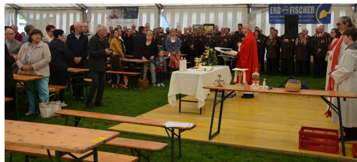
Besucher*innen der Messe