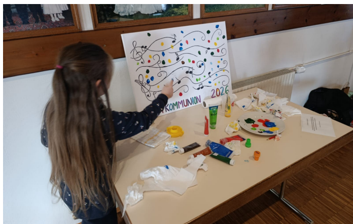
Erstkommunion-Kinder basteln im Pfarrsaal