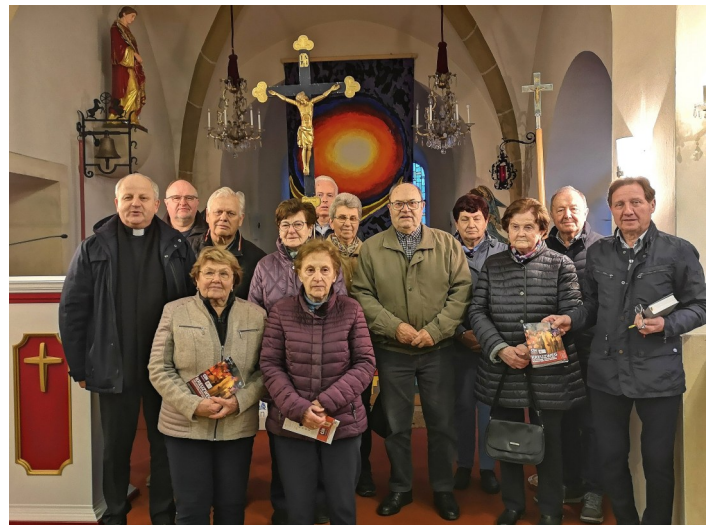
Teilnehmer*innen des Kreuzweges