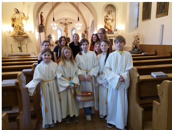
die Ministrant*innen und ihre Geschenke