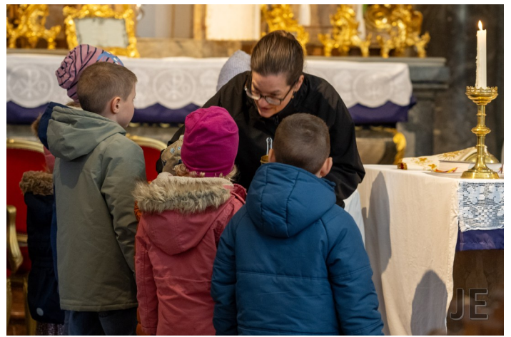
Kinder legen die Zutaten in den Suppentopf