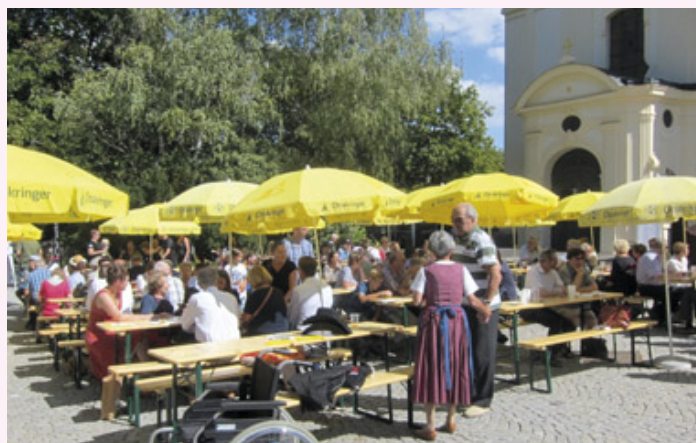
Der Rodauner Kirtag findet jedes Jahr am zweiten Sonntag im September statt

An jedem zweiten Sonntag im September findet seit über zwanzig Jahren der Rodauner Kirtag statt, ein beliebtes