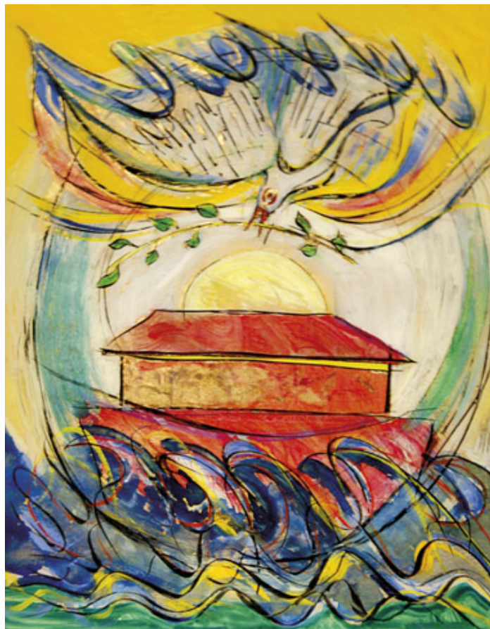
Gott fängt nach der Sintflut neu an: Darstellung der Arche Noah von Gerhard Winkler in der Heiligen Theresia-Kapelle in Schwarzenberg (Vorarlberg).