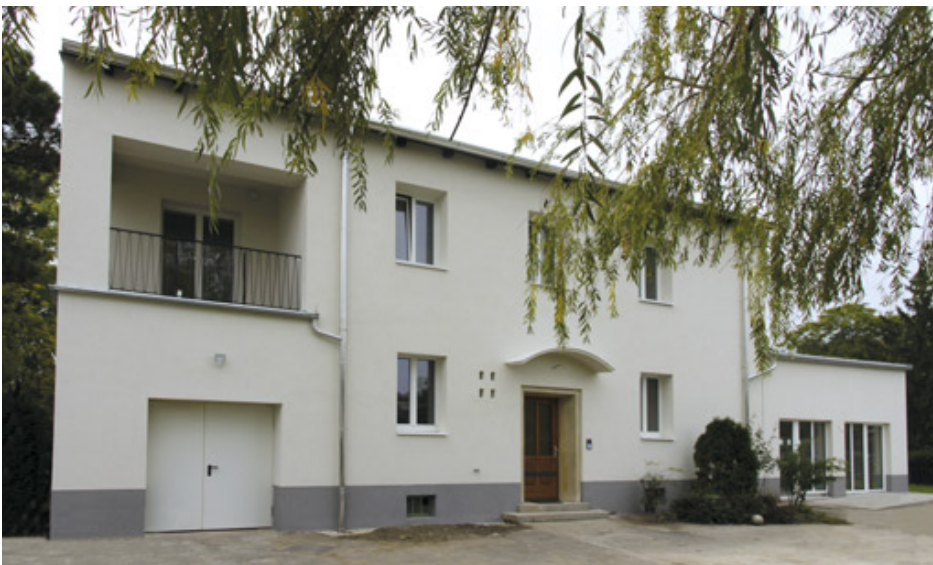
Der umgebaute Pfarrhof bietet neben den Priesterwohnungen auch ein Büro für die Pfarrkanzlei und einen Multifunktionsraum mit behindertengerechtem Zugang.