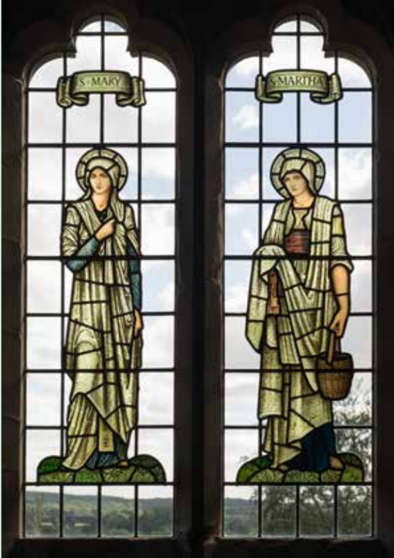
Maria und Marta als Glasmalerei der All Saints Kirche, in Preston Bagot, England. Die Buntglasfenster wurden von Edward Burne-Jones entworfen und von Morris & Co aus Birmingham gestaltet