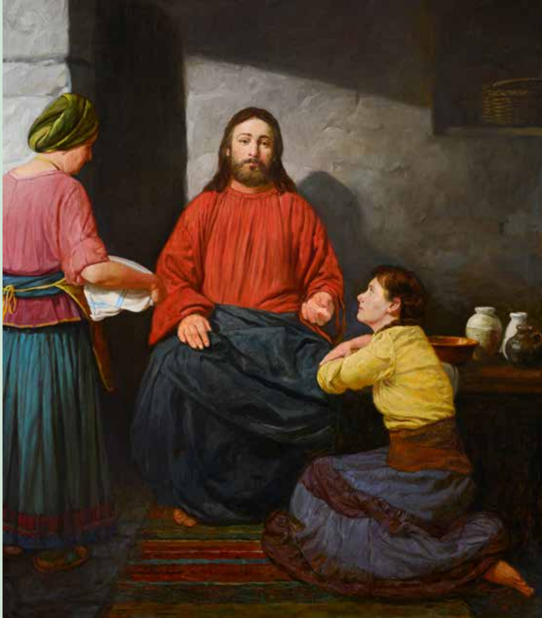
Gemälde von Jesus im Haus von Marta und Maria, 2018, Andrei Mironov / Creative Commons Lizenz

Innenteil zum Herausnehmen. Klammer lösen und mitnehmen.