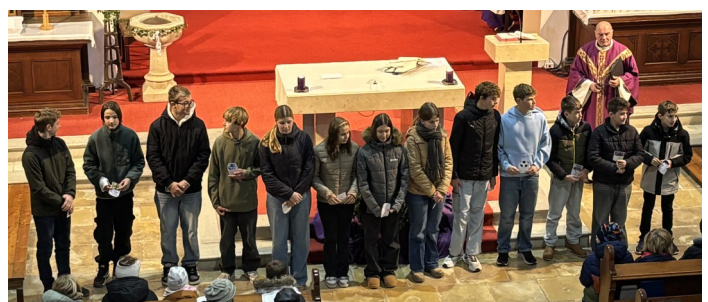
Text, Foto: Monika Postel, Foto Kirche: Maria Jirak

Wir, das Firmbegleitungsteam, wünschen allen eine erfüllte und inspirierende Zeit, in der sie ihre Beziehung zu Gott weiter vertiefen können.