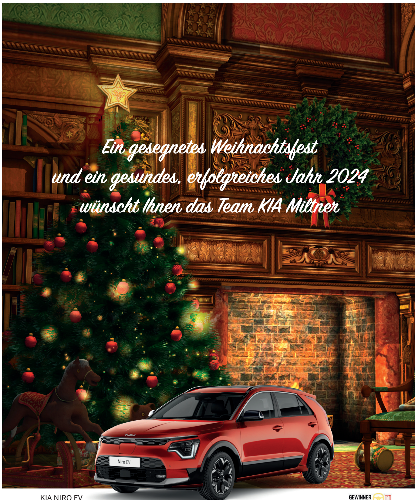
KIA NIRO EV