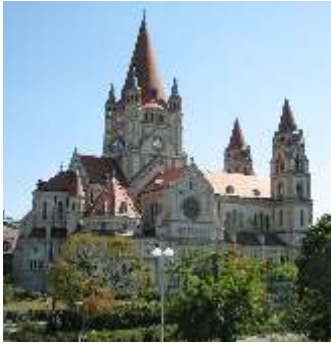
Kaiserjubiläumskirche 1020 Wien, Mexikoplatz 12