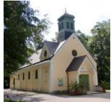
Kirche Maria Grün 1020 Wien, Aspernallee 1