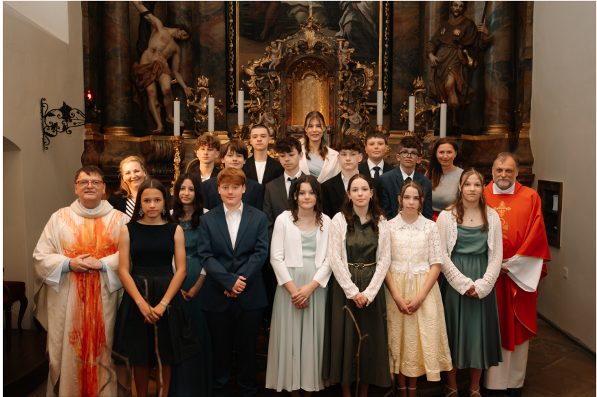
Die Firmgruppe mit dem Firmspender (ganz links)