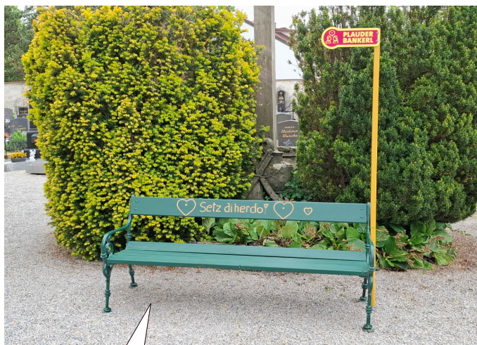
Das neue Plauderbankerl am Friedhof