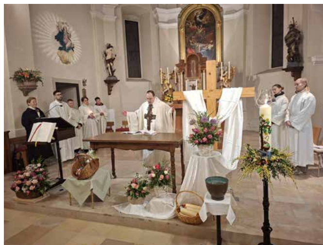
Im Blumenschmuck bleibt der Korb die ganze Osterzeit bis Pfingsten sichtbar.

Auch die Ratschenkinder prägten die Kartage. Viele von ihnen übernachteten in der Pfarre und ersetzten in diesen Tagen das Glockengeläute. Sie waren im Ort unterwegs, feierten in der Kirche mit und übernahmen liturgische Dienste. So wurde eine alte Tradition lebendig gehalten und in die Feier der Gemeinde eingebunden.