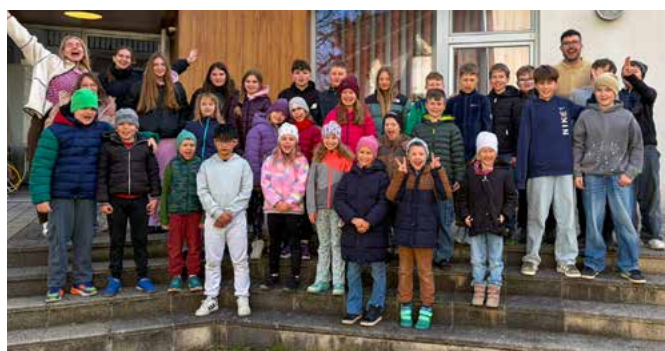
Ratschenkinder halten die Tradition lebendig.