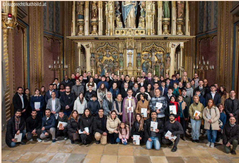
Gruppe der Taufbewerber und Taufbewerberinnen, die am 6. März 2025 in der Augustinerkirche zur Eingliederung in die Kirche zugelassen wurden. Unter ihnen ist auch eine junge Taufbewerberin aus Enzersdorf, die in der Feier der Osternacht in Schwadorf die Sakramente des Christwerdens empfangen wird.