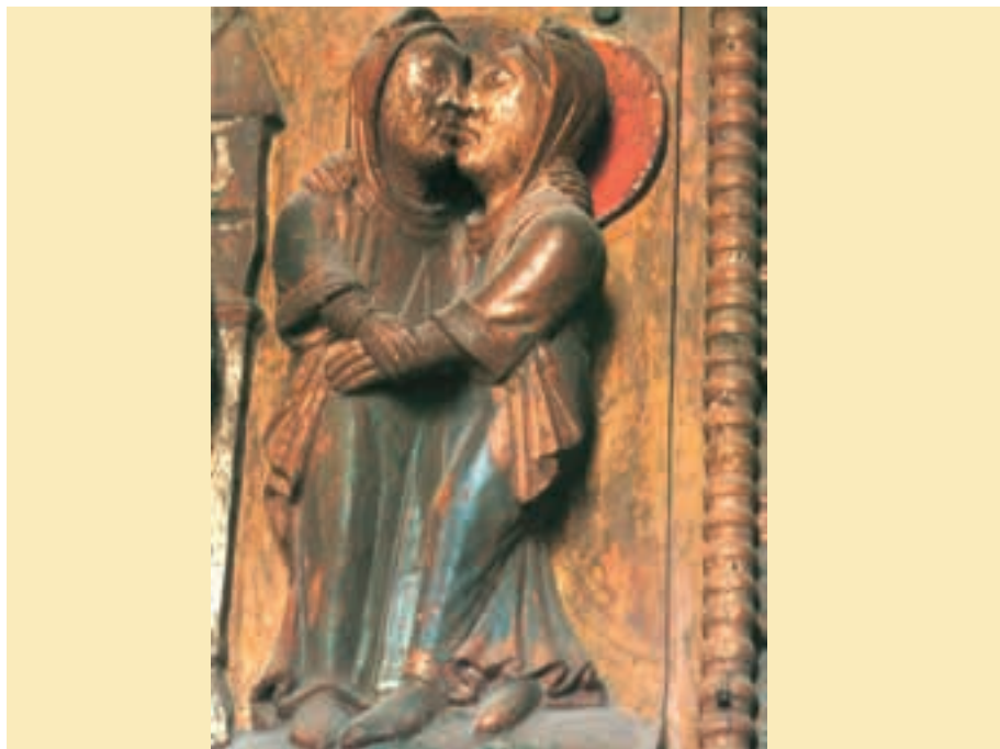
Heimsuchung, Holztür, St. Maria im Kapitol, Köln, um 1065

Die Begegnung der beiden Frauen Maria und Elisabeth ist liebevoll und voll Freude im Hl. Geist. Sie freuen sich nicht nur über das je eigene Geschenk, sondern ebenso – ja sogar noch mehr – über das auch der anderen Geschenke. Genau das ist es, was der Kirche heute in so vielen Bereichen Not tut: Die Freude an dem, was (auch) des anderen ist. Das gemeinsame Priestertum aller Getauften und das Priestertum des Dienstes stehen nicht als Konkurrenz gegeneinander, sondern sind aufeinander verwiesen und bereichern einander.