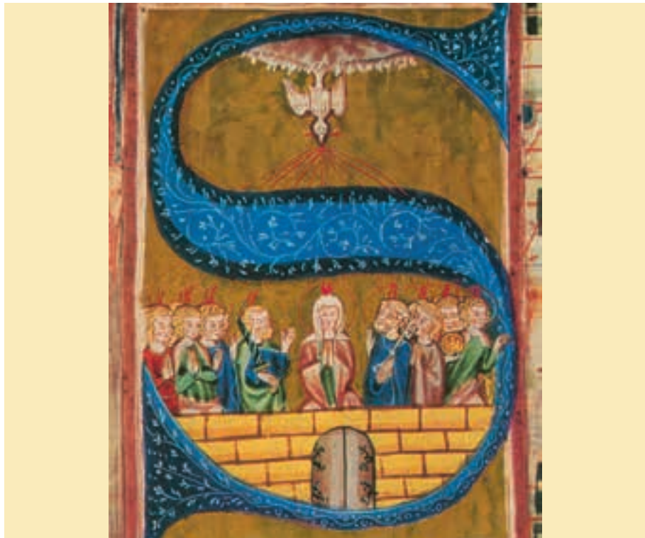
Pfingsten, Initiale, Wonnental/Breisgau, um 1350

Maria ist zugleich die Kirche, die Gemeinschaft der Glaubenden, die Mitte, der alle Ämter und Dienste (auch Petrus mit dem Schlüssel) zugeordnet sind.