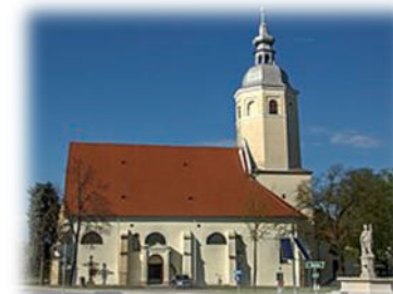
Die Wallfahrtskirche Maria Moos bei Zistersdorf im Weinviertel