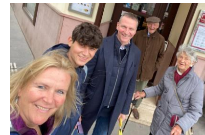
(Pfr Joh mit Schwester, Neffen, Eltern)

Sich glücklich erinnern... Mein neues Smartphone zeigt mir immer wieder ein Foto von vergangenen Zeiten. Das erscheint dann am Display und erinnert mich an schöne Momente oder an Orte, an denen ich war und an Menschen, mit denen ich ein Foto machte. Ich versuche das dann zu einem Gebet zu machen: „Danke, dass ich das erleben durfte und Herr, ich bitte dich für diese Person um Schutz und segne unsere Freundschaft/Beziehung.“ Ich will aber nicht vergessen: mein Leben lebe ich jetzt. Ich soll den Moment leben, jetzt ja sagen, jetzt zuhören, jetzt zu Hilfe eilen, heute und jetzt den Tagesplan haben usw. Gott segne uns alle, damit wir heute zum guten Tag machen, dass wir in der Gegenwart gerne unser Leben leben!