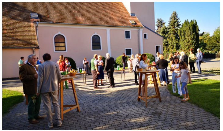
Nach dem Fest bei der Agape