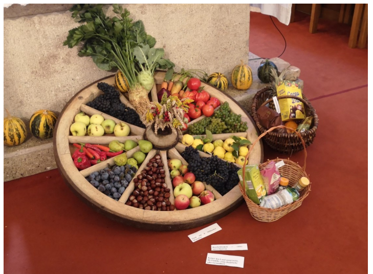
Das wunderschöne Ernterad mit den Erntegaben