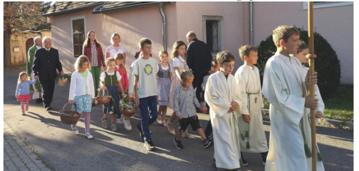
Die Kinder mit den Erntegaben beim Einzug in die Kirche