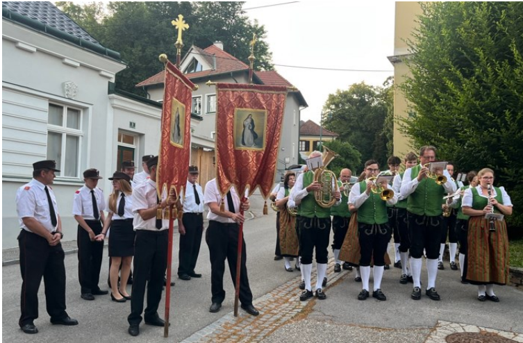
Abordnung der Feuerwehren Königsbrunn - Hippersdorf und Musikverein Absdorf