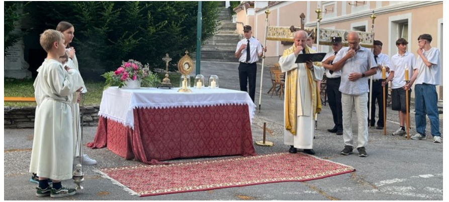
Altäre bei der Fronleichnamsprozession