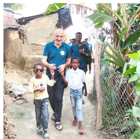
Am Weg ins Dorf

„Meine Frau und ich unterstützen die Teilnehmer des Priesterseminars in Bangladesch, weil uns die Förderung von Bildung besonders am Herzen liegt. In einem Land, in dem viele Menschen nur begrenzten Zugang zu Ausbildung haben, sehen wir darin eine wichtige Investition in die Zukunft. Das Seminar bietet jungen Männern die Möglichkeit, sich nicht nur theologisch, sondern auch menschlich und sozial weiterzuentwickeln. Wir sind überzeugt, dass gut ausgebildete Priester eine bedeutende Rolle in ihren Gemeinden spielen können. Sie spen-