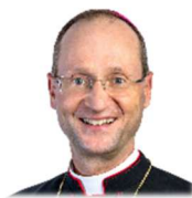
Weihbischof Stephan Turnovszky

Ab Herbst 2026 werden alle Pfarren im Dekanat Stockerau und somit auch alle sieben Pfarren im Pfarrverband Sierndorf-Großmugl von Weihbischof Stephan Turnovszky visitiert. Was bedeutet das?