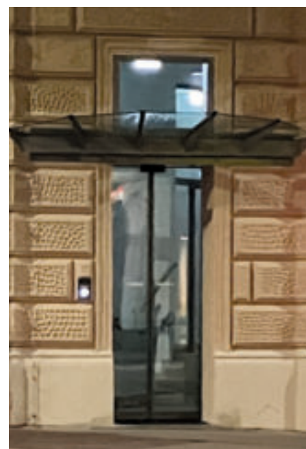
Der alte und der neue, barrierefreie Eingang zum Pfarrbüro