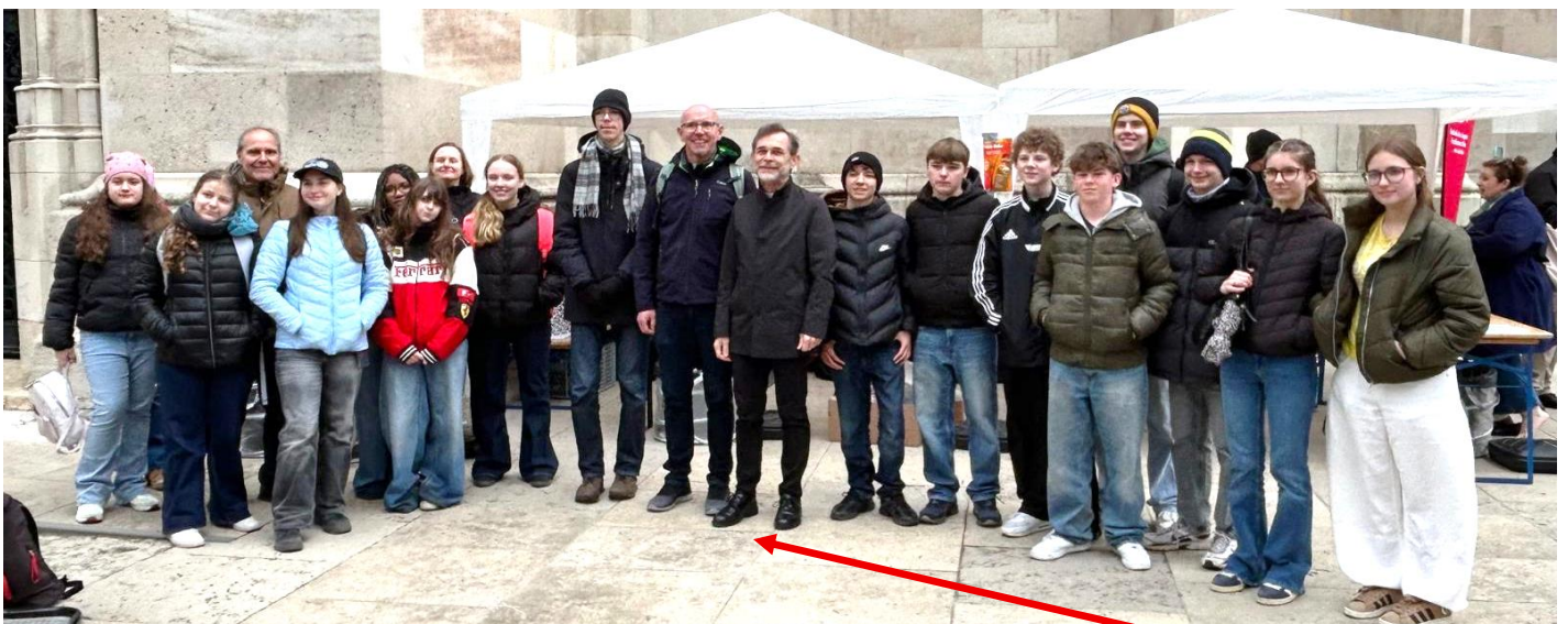
Die Neuerlaaer Firmlinge mit Erzbischof Josef Grünwidl