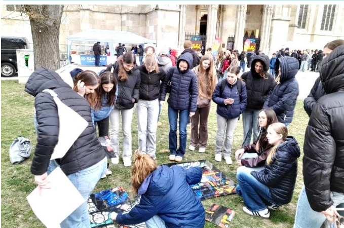
Alle Bilder Richard K. Langat