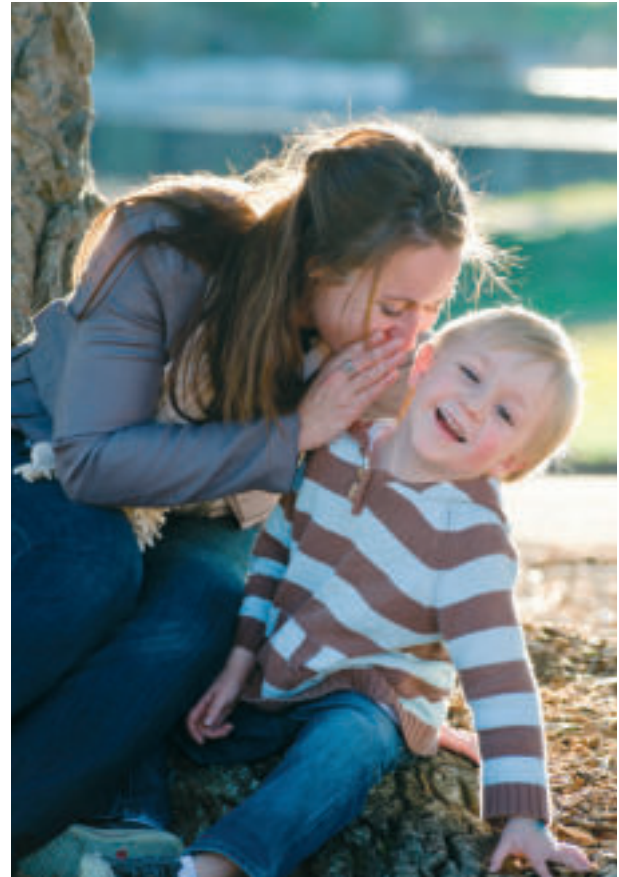
Einander zuhören ist eine der wichtigsten Fähigkeiten für Familien