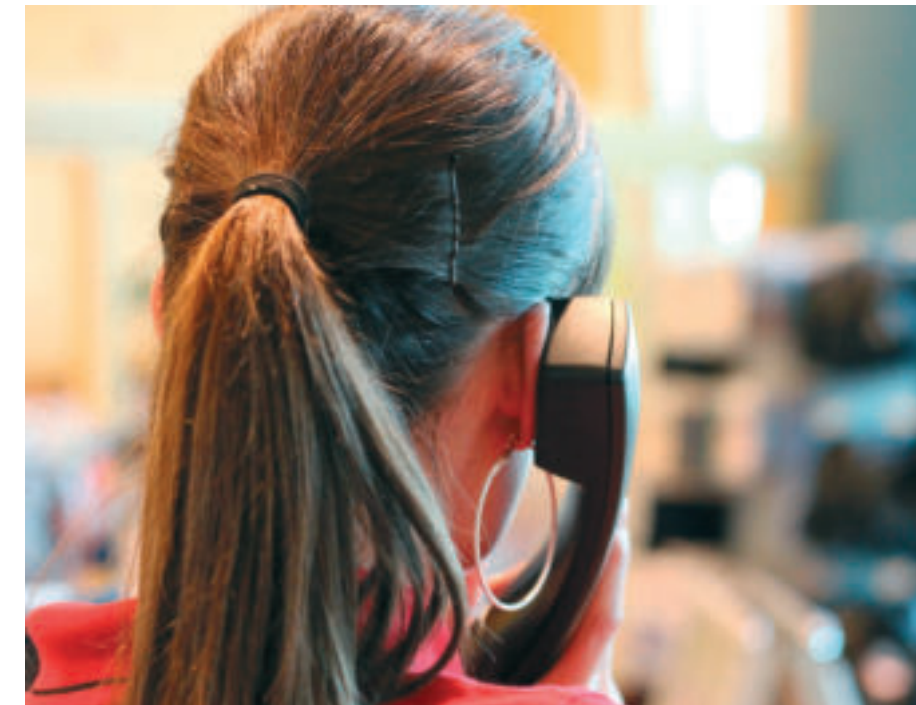
Rund um die Uhr helfen die ehrenamtlichen Mitarbeiter/innen der Telefonseelsorge anonym weiter:

Rund 160 ehrenamtliche Mitarbeiter/innen sind dafür am anderen Ende der Leitung im Einsatz. Ein Jahr lang dauert ihre Ausbildung. Nach einem Einführungskurs hören sie zu Beginn noch zu, bevor sie mit einem Mentor / einer Mentorin dann selbst die ersten Telefonate führen. „Unsere Mitarbeiter/innen müssen stabil und empathisch sein und auch belastbar – es ist ja doch ein Ehrenamt, das viel Zeit und Verlässlichkeit erfordert“, so Keßelring. Unterstützt werden die Mitarbeiter/innen durch eine einmal im Monat stattfindende Supervision: