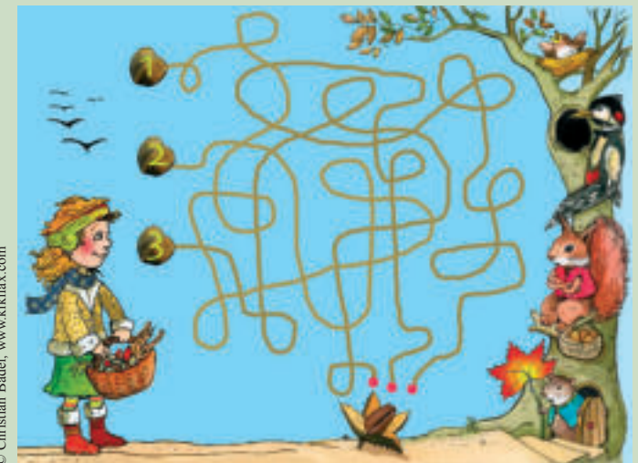
Pia sammelt bei einem Herbstspaziergang im Wald in ihrem Korb Herbstfrüchte zum Basteln. Unter der Buche findet sie jede Menge der lustigen dreiteiligen Früchte mit dem stacheligen Mantel. Welchen Weg muss sie wählen, um zur Bucheckernfrucht zu gelangen?