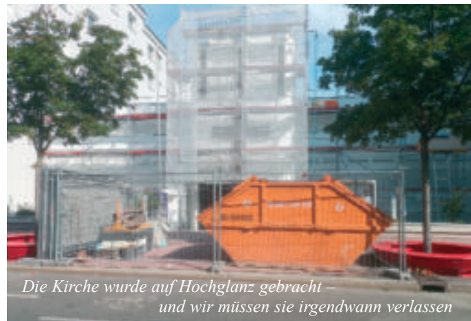
Die Kirche wurde auf Hochglanz gebracht – und wir müssen sie irgendwann verlassen

Nutzer vertraglich fixiert ist. Auch das Pfarrbüro in der Embelgasse 3 wird weiterhin jeweils Dienstag und Donnerstag am Nachmittag für Ihre Anliegen zur Verfügung stehen. Karlheinz Richter