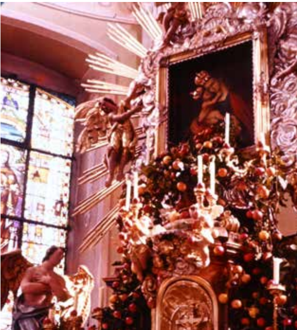
Bild links: Das Glasfenster an seinem ursprünglichen Anbringungsort (Undatiert, vmtl. 1964)