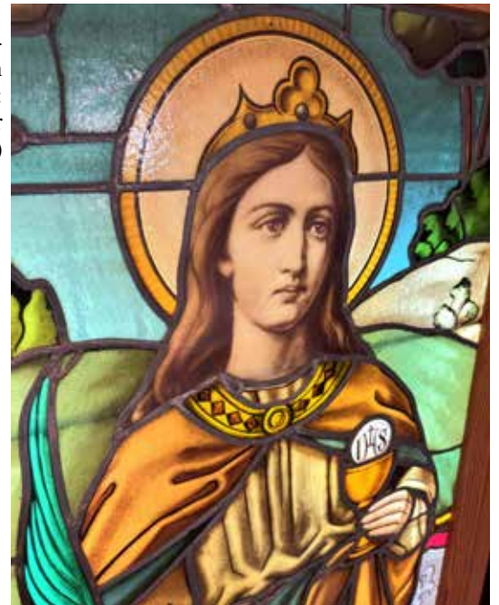
Bild: rechts, Glasgemälde wieder in Pfarrbesitz