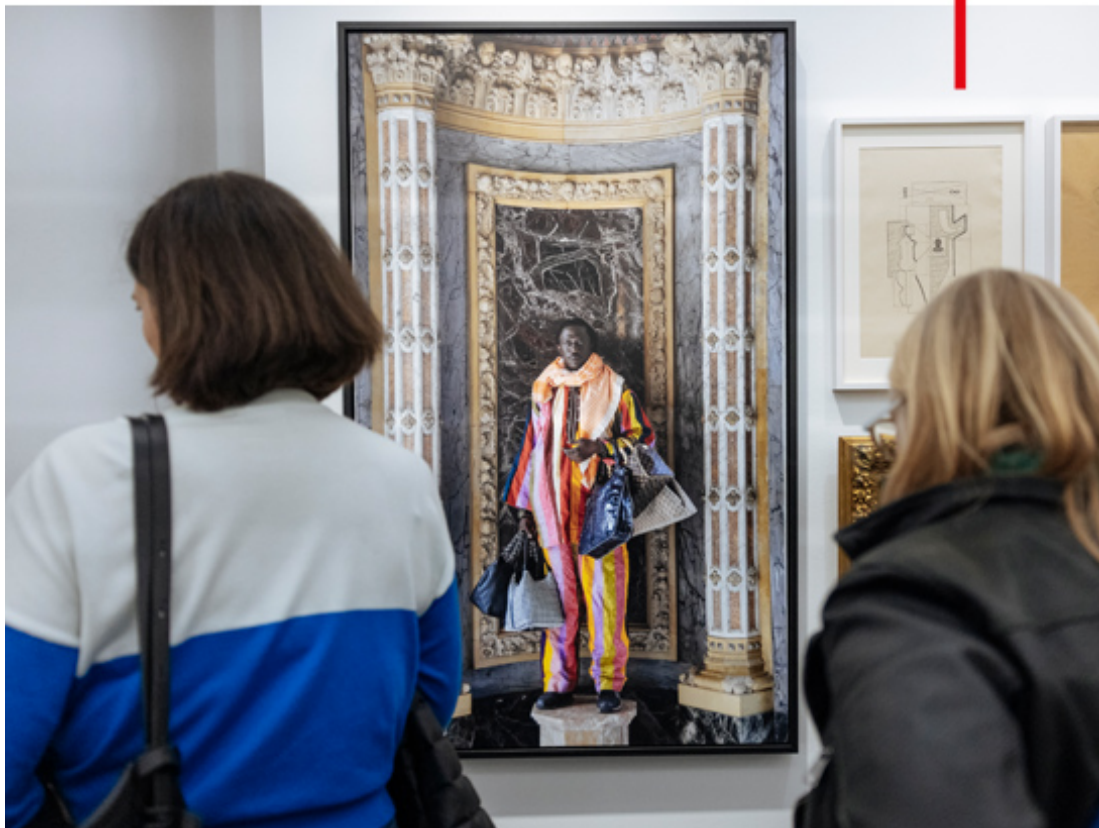
Besucherinnen der Ausstellung „Alles in Arbeit“, Foto: Marlene Fröhlich, marlene.at